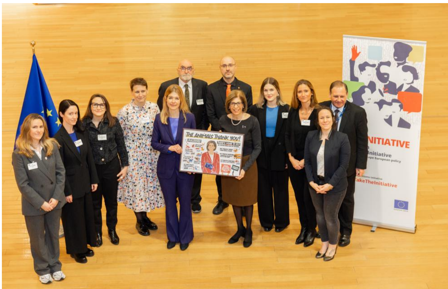
Visit of Representatives of the European Citizens' Initiative 'Fur Free Europe' to the European Commission