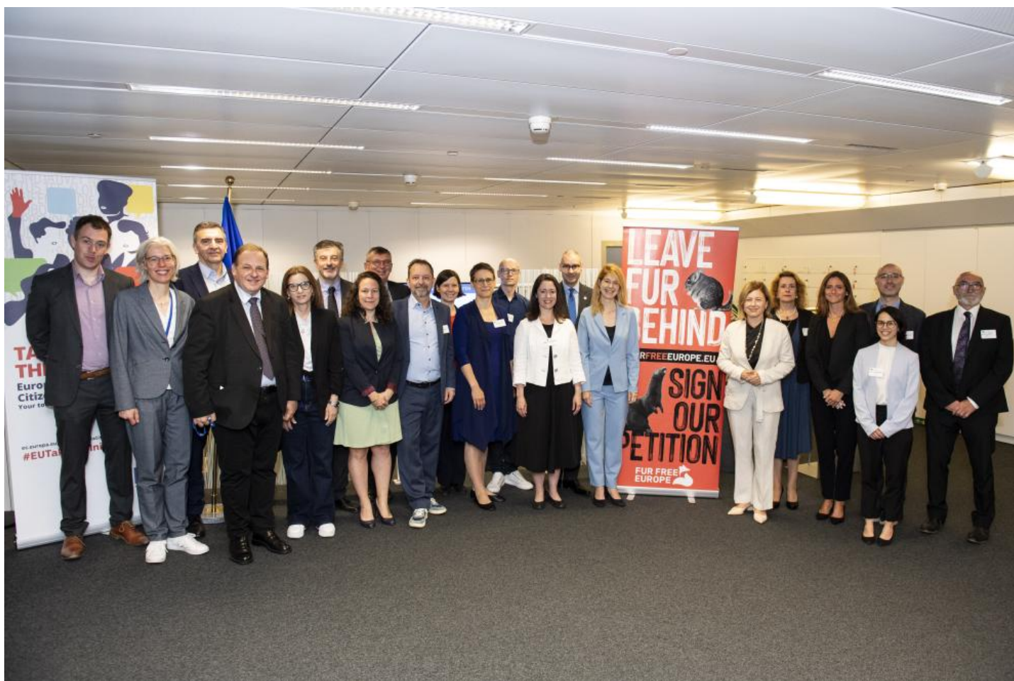
Visit of representatives of the successful European Citizens' Initiative 'Fur Free Europe' to the European Commission

Après la présentation officielle de l'initiative «Pas de fourrure en Europe», les organisateurs ont rencontré Věra Jourová , vice-présidente de la Commission européenne chargée des valeurs et de la transparence, et Stella Kyriakides , commissaire à la santé et à la sécurité alimentaire, le 20 juillet 2023 ( communiqué de presse ).