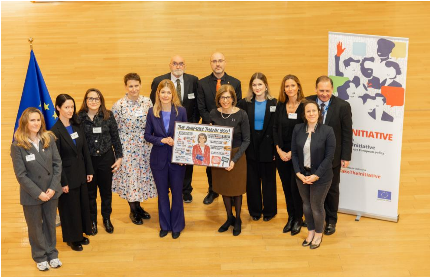
Visit of Representatives of the European Citizens' Initiative 'Fur Free Europe' to the European Commission